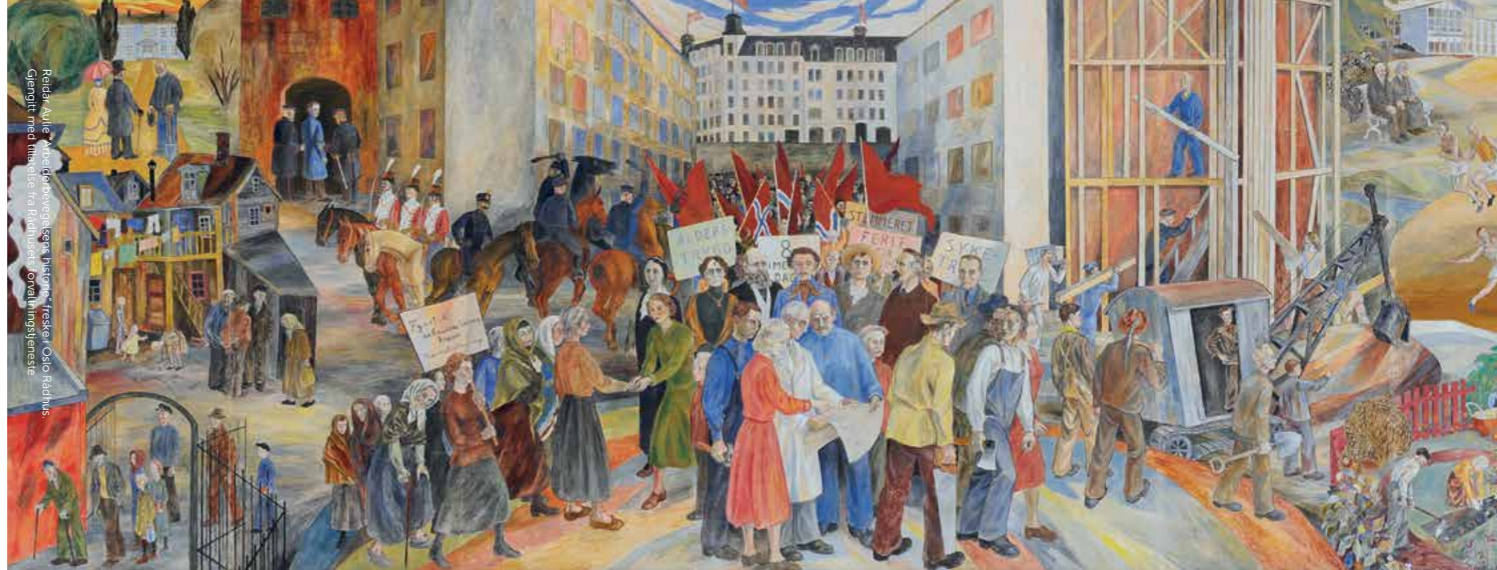
Reidar Aulie, "Arbeidendevegens historie", freske i Oslo Rådhus. Gjengitt med tillatelse fra Rådhusets formidlingsenhet.