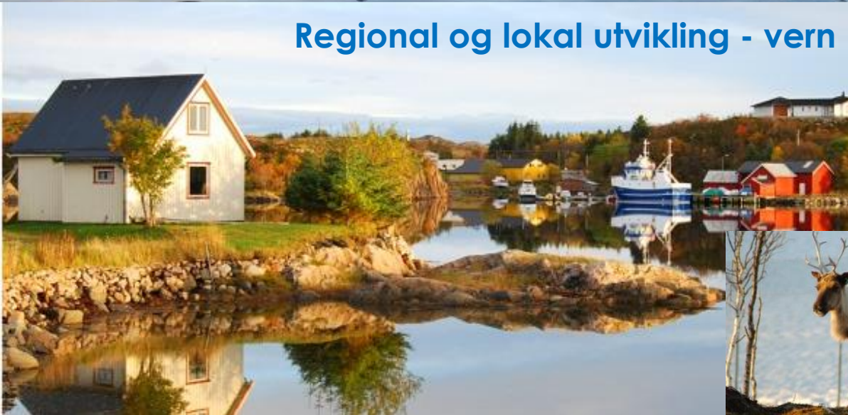
Regional og lokal utvikling - vern