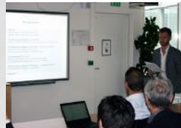
Legally Binding Land-Use Plan