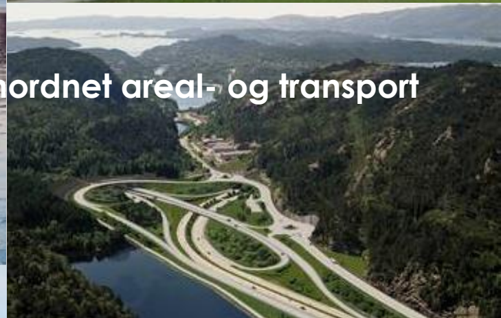
Samordnet areal- og transport