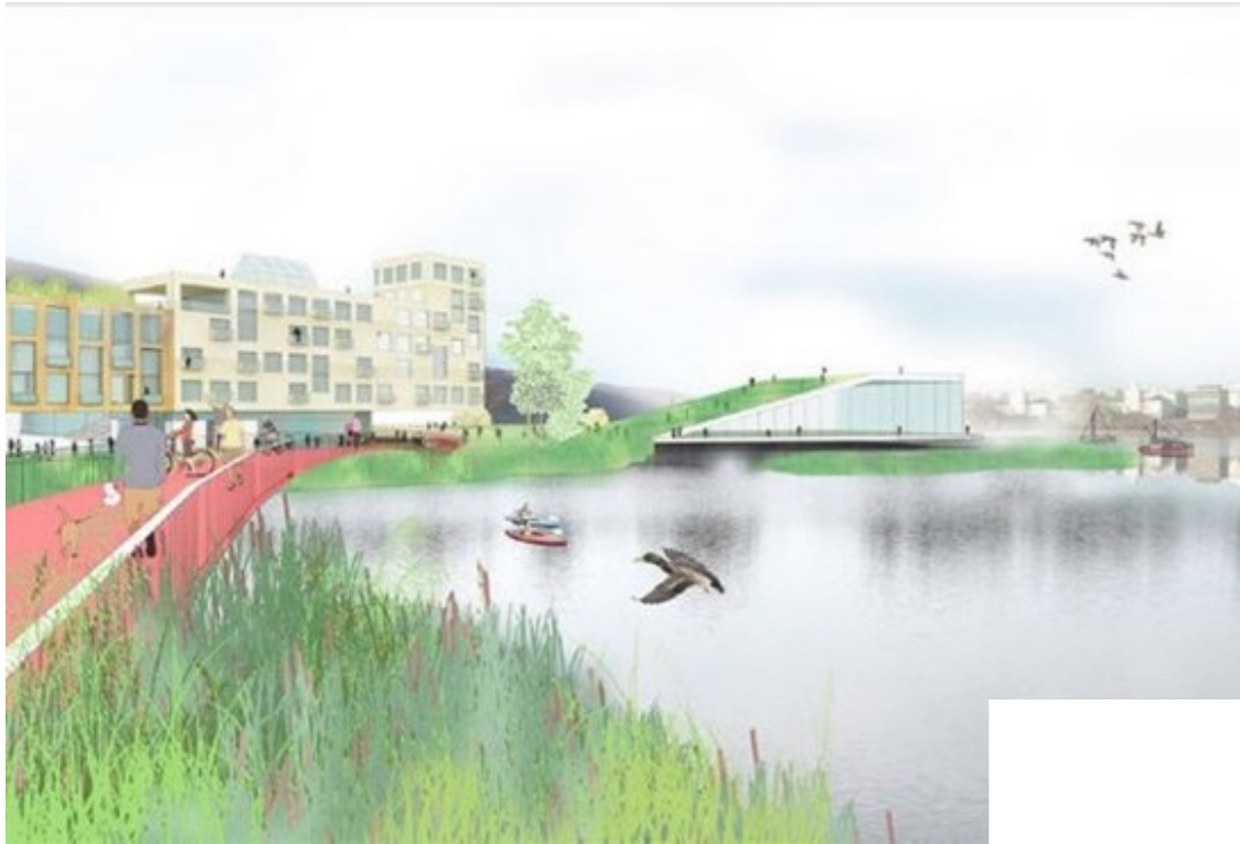
Grønneviksøren, Bergen Europas 2015