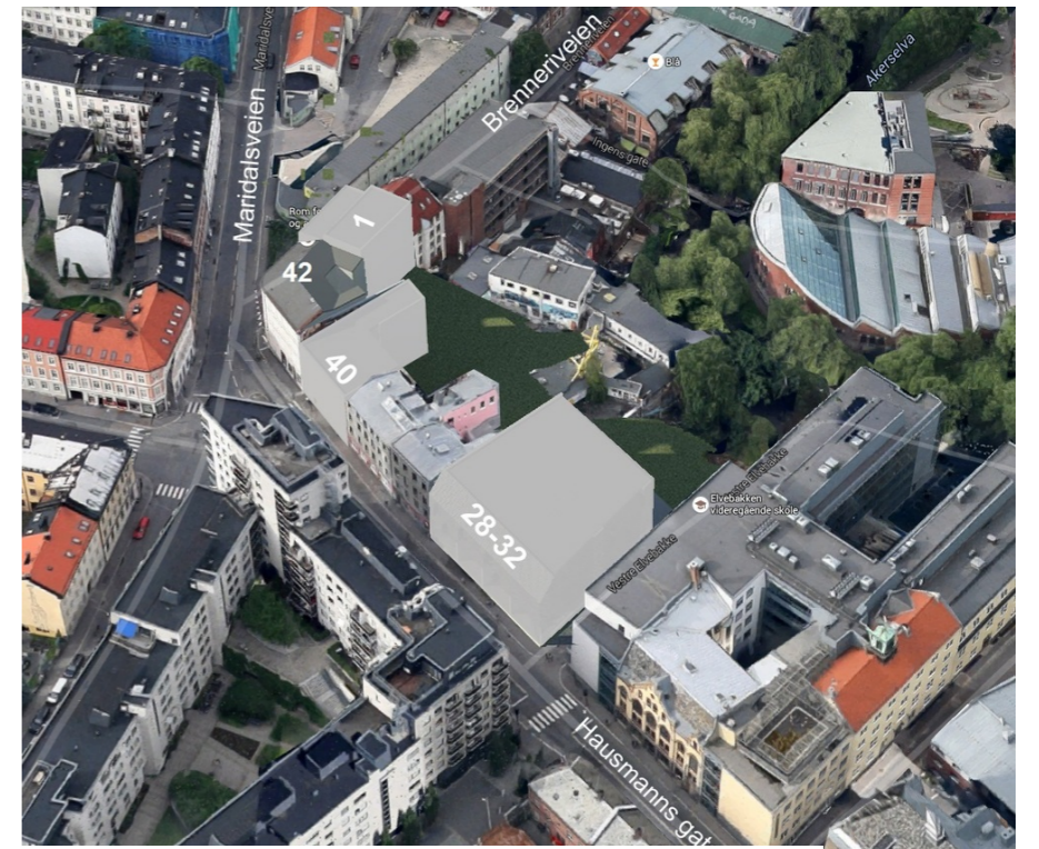
Byøkologisk kvartal Hauskvartalet, Oslo