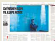
Klassekampen 24. januar

■ Klassekampen vil i en serie saker se på salg av offentlig eiendom.