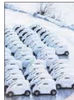
UT AV NISJA: Elbiler ved Drammen havn.